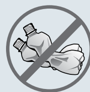
нема повеќе вода во пластика