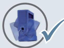
едноставна промена на филтер